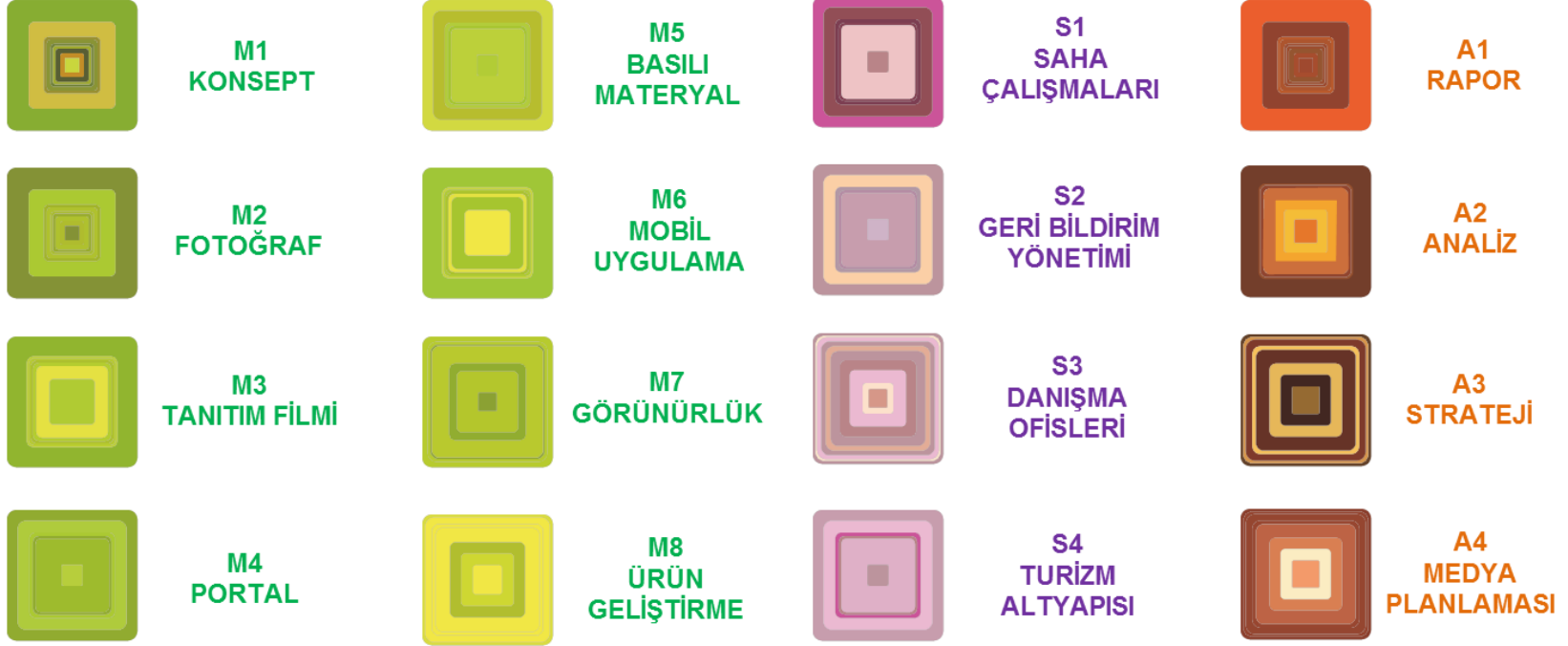
Şekil 4: Bütünleşik Turizm Projesi Modülleri