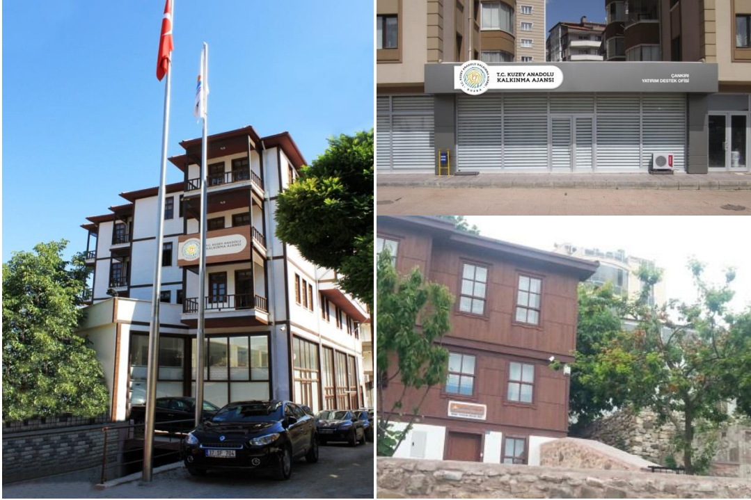
Tablo 1: Hizmet Binası ve Ofisleri

1 Haziran 2011 tarihinde fiilen faaliyetlerine başlayan Yatırım Destek Ofisleri'nden (YDO), Kastamonu YDO, kuruluşundan bu yana Ajans hizmet binasında, Çankırı YDO 25.05.2016 tarihinden itibaren yeni taşındığı ofisinde ve Sinop YDO ise restore edilmiş binasında hizmet vermektedir.